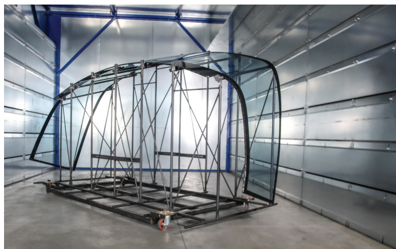
Immagine in alto: definizione di forme di vetro complesse e curve realizzate utilizzando la modellazione avanzata delle superfici di CATIA sulla piattaforma 3DEXPERIENCE .